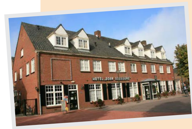
Hotel Boer Goossens