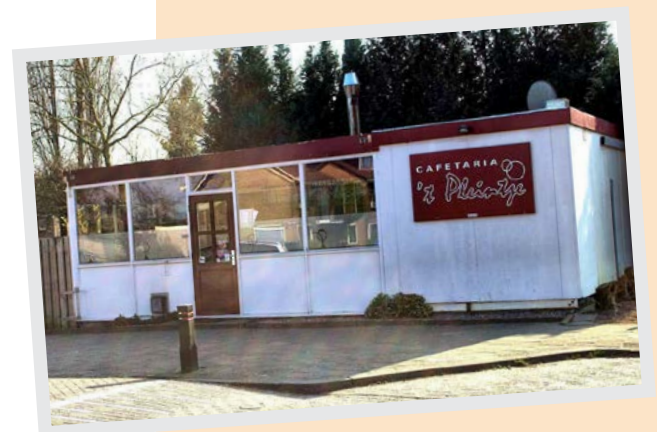
Cafetaria 't Pleintje