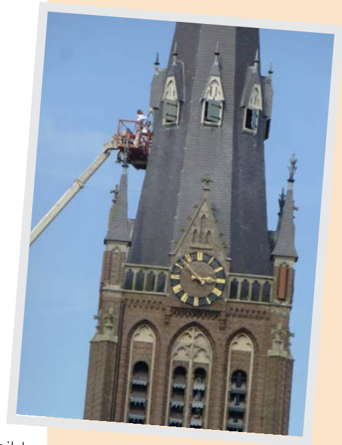
Schilderen Dungense kerk

Wie heeft het huidige logo van de heemkundevereniging “Op die Dunghen” ontworpen?