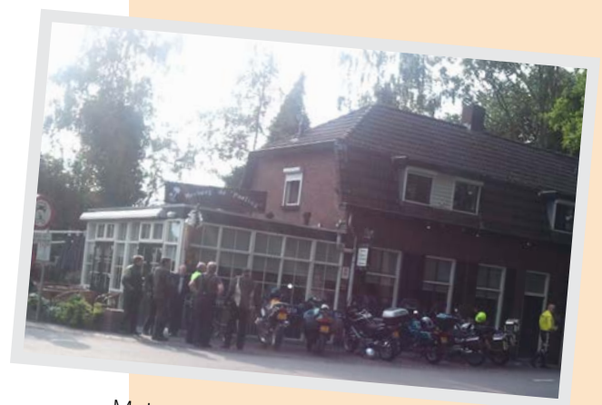
Majorcabar / Herberg de Poeling

Hoeveel appartementen bevinden zich in het flatje tegenover cafetaria 't pleintje?