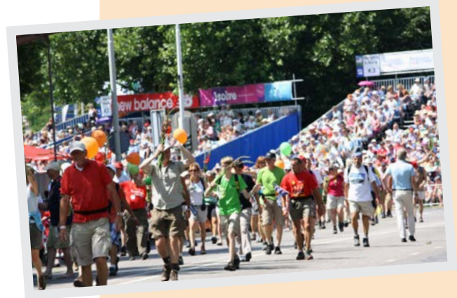
Nijmeegse Vierdaagse

Met Sinterklaas in aantocht liepen de gemoederen rondom de toekomst van Zwarte Pieten hoog op. Zelfs de Verenigde Naties gingen zich er mee bemoeien. Hoe heette de Jamaicaanse VN ambtenaar die Zwarte piet fel bekritiseerde?