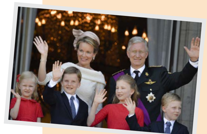
Een gedeelte van het Belgisch Koningshuis