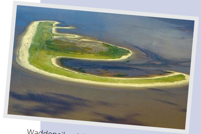
Waddeneiland (behorend bij vraag 59)