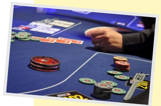
European Poker Tour

Hoeveel punten haalde de winnaar van het Eurovisie songfestival 2013?